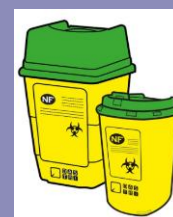
Boîte à aiguilles au grand et petit format

Éco-organisme agréé par les pouvoirs publics, DASTRI répond à un enjeu de santé publique fort : mettre à disposition des bénéficiaires une solution de proximité simple, gratuite et sécurisée. 22 pathologies sont concernées par le dispositif. Disponible gratuitement dans toutes les pharmacies, la boîte à aiguilles DASTRI permet de collecter les déchets de soins perforants qui représentent un risque pour la collectivité et qui doivent être triés pour la sécurité de tous. Les boîtes doivent ensuite être rapportées dans un point de collecte géolocalisable via le site Dastri.fr .