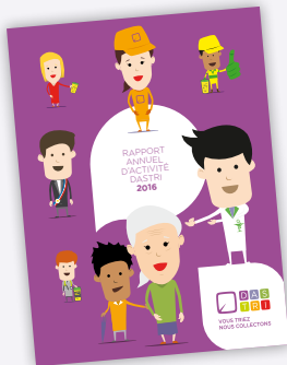
Rapport d'activité 2016