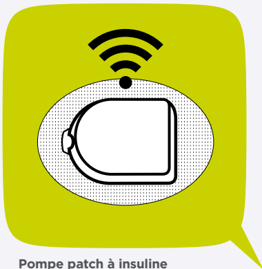
Pompe patch à insuline

autotests VIH, montrent que les boîtes à aiguilles DASTRI, conçues pour les patients en auto-traitement, n'ont été proposées par les pharmaciens aux acheteurs d'autotests que dans 54 % des cas (enquête 2015) et 32 % (enquête 2016), la principale raison étant que les pharmaciens ne pensent pas à remettre une boîte en même temps que le kit de test (41 % des répondants concernés). Invités à formuler