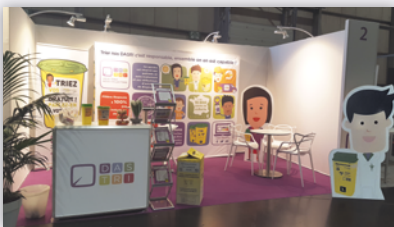
Stand DASTRI au congrès de la SFD

• DASTRI sponsor du Congrès de la SFD pour la première fois. Avec plusieurs milliers de participants, dont près de la moitié issus des pays francophones du monde entier, le congrès de la Société Francophone du Diabète s'est imposé comme l'un des trois principaux congrès internationaux dédié au diabète. Le stand DASTRI a permis aux représentants de l'éco-organisme d'échanger avec les adhérents présents et