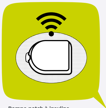
Pompe patch à insuline